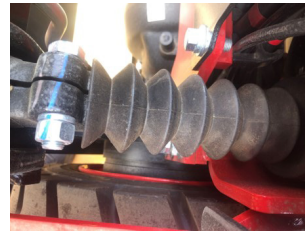
Tilt Silindir Koruması