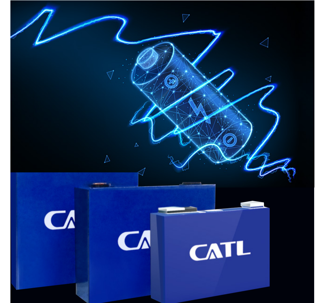
CATL MARKA AKÜ