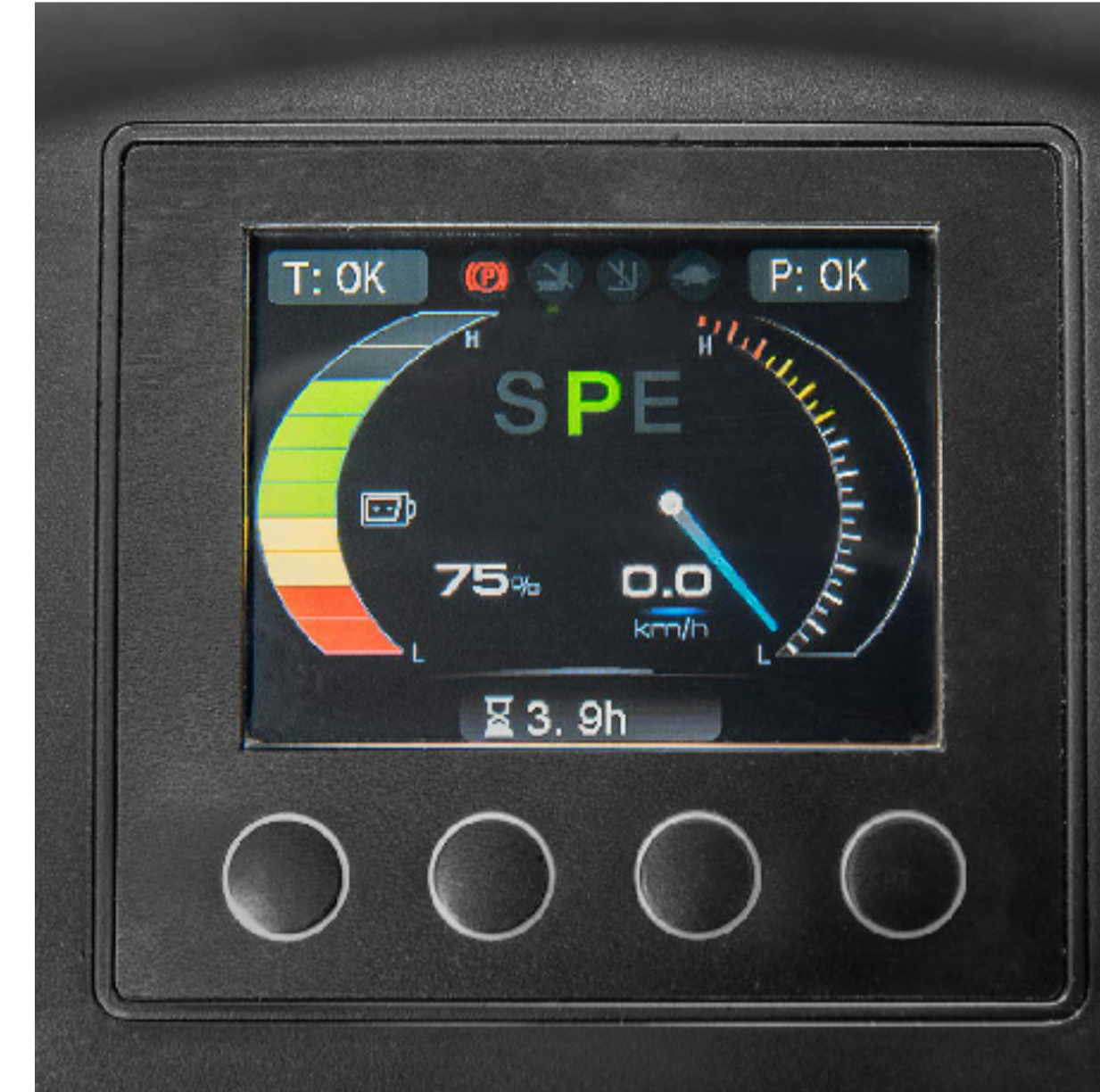
ÇOK FONKSİYONLU ZARİF RENKLİ GÖSTERGE