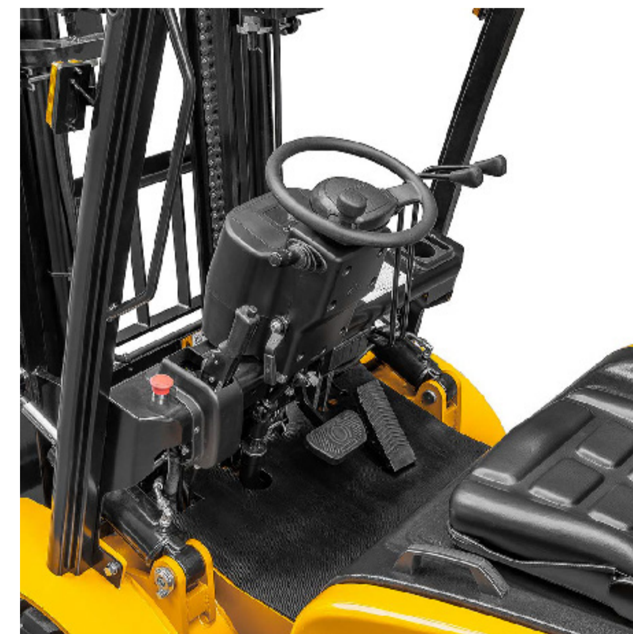
KONFORLU KULLANIM ALANI